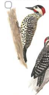
Carpintero Real Colaptes melanochlorus Green-barred Woodpecker