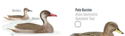
Pato Barcinó Anas flavirostris Speckled Teal Pato Cutiri Amazonetta brasiliensis Brazilian Teal