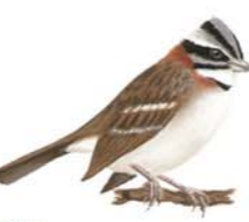
Chingolo Zonotrichia capensis Rufous-collared Sparrow