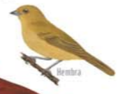
Arañero Coronado Chico Basileuterus culicivorus Golden-crowned Warbler