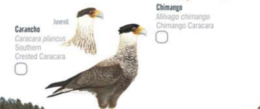
Carancho Caracara plancus Southern Crested Caracara Gavián Planeador Circus buffoni Long-winged Harrier