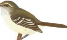
Mosqueta Común Phylloscartes ventralis Mottled-cheeked Tyrannulet