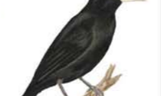
Federal Amblyramphus holosericeus Scarlet-headed Blackbird