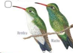
Picaflo Común Chlorostilbon aureoventris Glittering-bellied Emerald