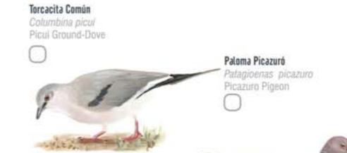
Torcacita Común Columbina picui Piculet Paloma Picazuro Patagioenas picazuro Picazuro Pigeon