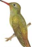
Picaflo Bronceado Gilded Sapphire Gilded Hummingbird