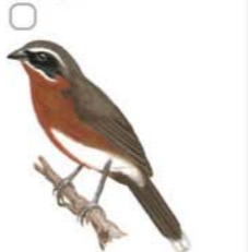
Sietevestidos Pooecetes nigrorufa Black-and-rufous Warbling-Finch