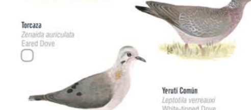
Torcaza Zenaida auriculata Eared Dove Yeruti Común Leptotilia verreauxi White-tipped Dove