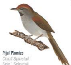
Pijui Plumizo Chicli Spinetail Spix' Spinetail