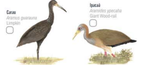
Carau Aramus guarauna Limpkin Ipacaá Aramides ypecaha Giant Wood-rail