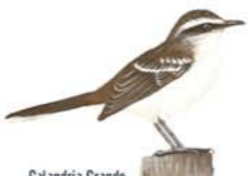
Calandria Grande Mimus saturninus Chalk-browed Mockinbird