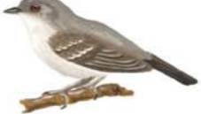
Piojito Gris Serpophaga nigricans Sooty Tyrannulet