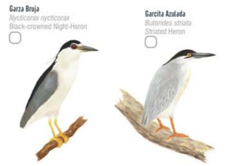
Garza Bruja Nycticorax nycticorax Black-crowned Night-Heron Garcita Azulada Butorides striata Striated Heron