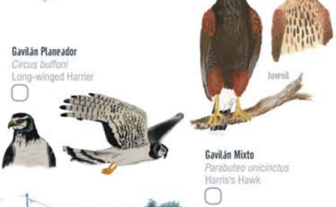
Gavián Mixto Parabuteo unicinctus Harris's Hawk Cuervo de Cañada Plegadis chihi White-faced Ibis