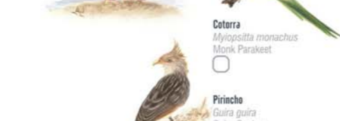
Cotorra Myiopsitta monachus Monk Parakeet Pirincho Guira guira Guira Cuckoo