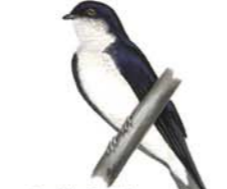
Golondrina Doméstica Progne chalybea Gray-breasted Martin