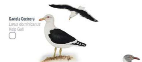
Gaviota Cocinera Larus dominicanus Kelp Gull Gaviota Capucho Gris Larus cirrocephalus Grey-headed Gull