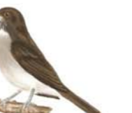
Zorzal Chachalero Turdus amaurochalinus Creamy-bellied Thrush