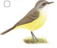
Picabeú Machetornis roxus Cattle Tyrant