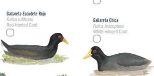
Gallareta Escudete Rojo Fulica rufifrons Red-fronted Coot Gallareta Chica Fulica leucoptera White-winged Coot