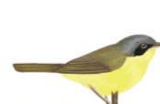
Pitiayumi Parula pitiayumi Tropical Parula