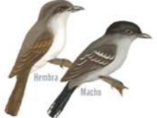
Anambé Común Pachyrhamphus polychropterus Ringed-winged Becard