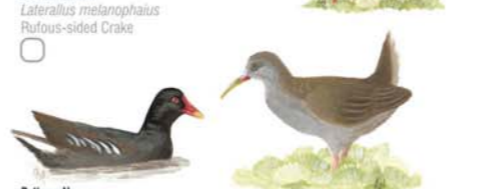
Burrito Común Lateralus melanophaius Rufous-sided Crake Gaviota Capucho Gris Larus cirrocephalus Grey-headed Gull