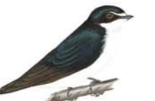
Golondrina Cejas Blancas Tachycineta leucorrhoa White-rumped Swallow