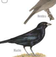
Tordo Renegrido Molothrus bonariensis Shiny Cowbird