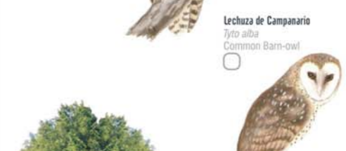
Lechuza de Campanario Tyto alba Common Barn-owl Gaviota Cocinera Larus dominicanus Kelp Gull

El Delta y la ribera del río siempre nos atrae... la refrescante cercanía del agua y el tupido follaje nos invitan a descubrir el paseo para el cual esta guía fue pensada. La guía, nos proporciona una herramienta para experimentar un agradable entretenimiento e incluso, constituye la puerta de ingreso al conocimiento de los pajaritos que habitan en lo verde.