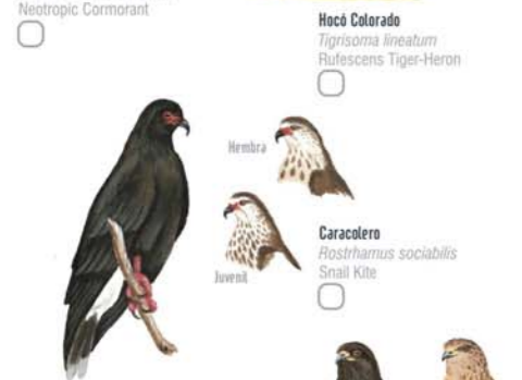
Caracolero Rostrhamus sociabilis Snail Kite Gavián Planeador Circus buffoni Long-winged Harrier