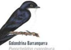
Golondrina Barranquera Pygochelidon cyanoleuca Blue-and-white Swallow