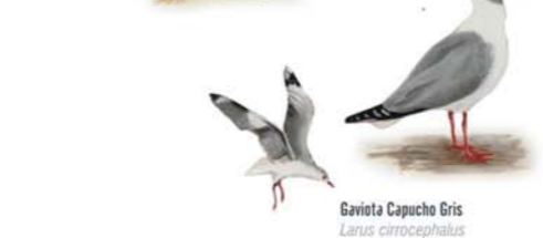
Gaviota Capucho Gris Larus cirrocephalus Grey-headed Gull Gaviota Capucho Café Larus maculipennis Brown-hooded Gull