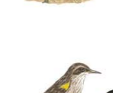
Varillero de Alas Amarillas Chrysomitris thilius Yellow-winged Blackbird