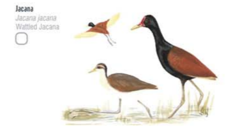
Jacana Jacana jacana Wattled Jacana Gaviota Cocinera Larus dominicanus Kelp Gull