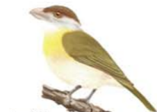
Juan Chiviro Cyclarhis gujanensis Rufous-browed Peppershrike