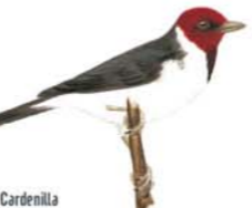
Cardenilla Paroaria capitata Yellow-billed Cardinal