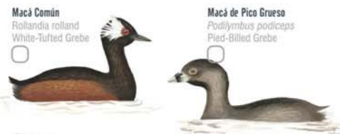
Macá Común Rollandia rolland White-tufted Grebe Macá de Pico Grueso Podilymbus podiceps Pied-billed Grebe