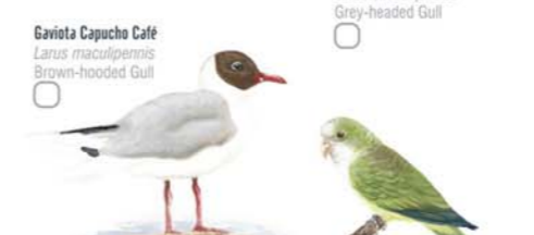
Gaviota Capucho Café Larus maculipennis Brown-hooded Gull Cotorra Myiopsitta monachus Monk Parakeet