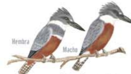
Martin Pescador Grande Ceryle torquatus White-winged Kingfisher