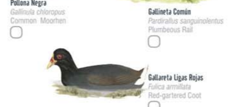
Pollona Negra Gallinula chloropus Common Moorhen Gallareta Ligas Rojas Fulica armillata Red-gartered Coot