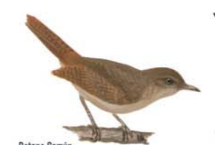
Ratona Común Troglodytes aedon House Wren