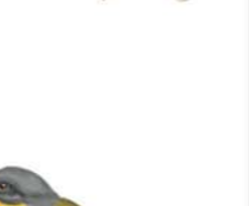
Tordo Músico Agelaioides badius Bay-winged Cowbird