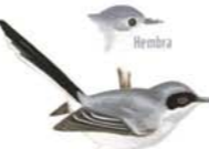
Tacuarita Azul Polioptila dumicola Masked Gnatcatcher