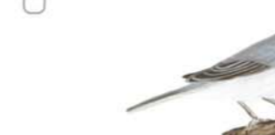
Celestino Común Thraupis sayaca Sayaca Tanager