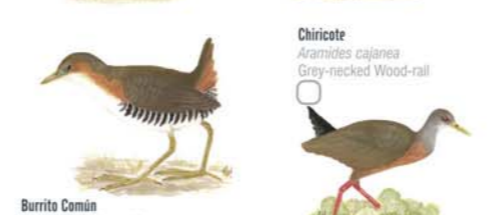
Chiricote Aramides cajanea Grey-necked Wood-rail Gaviota Cocinera Larus dominicanus Kelp Gull