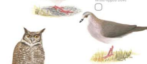
Yeruti Común Leptotilia verreauxi White-tipped Dove Lechuzón Orejudo Pseudoscops clamator Striped Owl