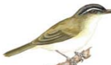
Chivi Común Vireo olivaceus Red-eyed Vireo