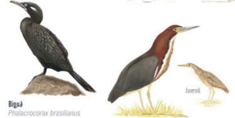
Biguá Phalacrocorax brasilianus Neotropic Cormorant Halcón Colorado Tigrisoma lineatum Rufescens Tiger-Heron