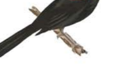
Federal Amblyramphus holosericeus Scarlet-headed Blackbird