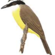
Benteveo Común Pitangus sulphuratus Great Kiskadee