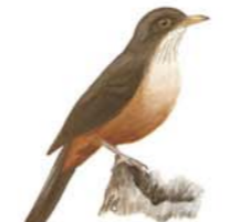
Zorzal Colorado Turdus rufiventris Rufous-bellied Thrush