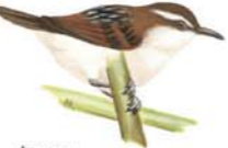
Junquero Phileocryptes melanops Wren-like Rushbird