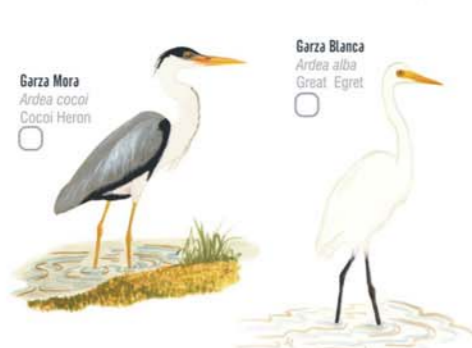
Garza Mora Ardea cocoi Cocoi Heron Garza Blanca Ardea alba Great Egret