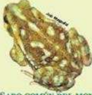
SAPO COMÚN DEL MONTE Rhinella arenarum mendocinus VU/10.2 cm LHC/Ovipara/Omnívora Estepas, pastizales y cuerpos de agua dulce