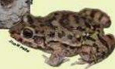
RANITA CAVADORA O RANA SAPO Leptodactylus bufonius NA/5.5 cm LHC/Ovipara/Omnívora Ambientes semiáridos y cuerpos de agua dulce