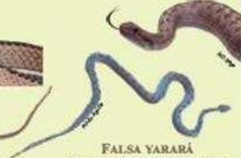
FALSA YARARÁ Pseudotomodon trigonatus NA/45 cm LHC/Ovípara/Saurófaga Médanos y laderas preandinas