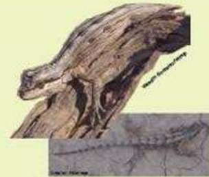
MATUASTO DEL PALO Leiosaurus paronae VU/11 cm LHC/Ovipara/Omnívoro Bosques algarrobo, arenales