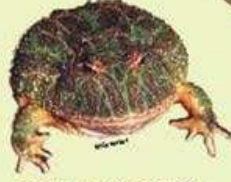
ESCUERZO CHAQUEÑO Ceratophrys cranwelli NA/10.5 cm LHC Ovipara/Omnívora/ Terrestre, fosorial y acuático