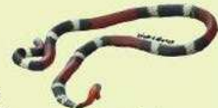
VIVORA CORAL Micrurus pyrrhocryptus NA/112,5 cm LHC Ovípara/Omnívora/Semi- subterránea. Suelos sueltos, vegetación abierta