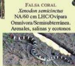
FALSA CORAL Xenodon semicinctus NA/60 cm LHC/Ovípara Omnívora/Semisubterránea. Arenales, salinas y ecotonos