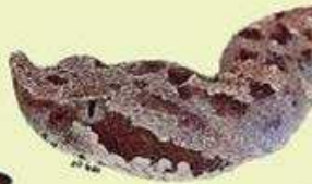
YARARÁ ÑATA Bothrops ammodytoides NA/105 cm LHC/Vivípara/Omnívora Roquedales, montañas, arenales