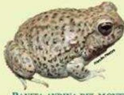
RANITA ANDINA DEL MONTE O RANITA DE 4 OJOS Pleurodema nebulosum NA/3.2 cm LHC/Ovipara/Insectívora Ambientes terrestres y acuáticos