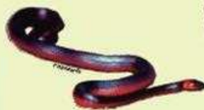
MUSSARANA Boiruna maculata NA/180 cm LHC/Ovípara/Ofiofaga Crepuscular y nocturna