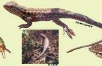
LAGARTIJA DE DARWIN Liolaemus darwini NA/6.5 cm LHC/Ovipara/Insectívora Médanos entre arbustales