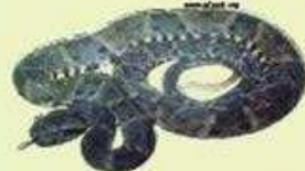
YARARÁ CHICA O COLA BLANCA Bothrops diporus NA/85 cm LHC Vivípara/Omnívora/Ambientes varios, cerca del agua