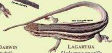
LAGARTIJA Liolaemus gracilis NA/5.5 cm LHC Ovipara/Insectívora/Estepas arbustiva, arenales, salinas