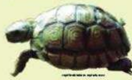
TORTUGA TERRESTRE ARGENTINA Chelonoidis chilensis VU/22 cm largo del caparazón/Ovipara Herbívora/Terrestre, fosorial. Ambientes áridos