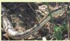
CULEBRA RATONERA O CONEJERA Philodryas trilineata NA/165 cm LHC/Ovípara/Omnívora Trepadora, suelos arenosos